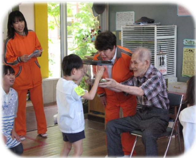
▲かたつむりに大感激