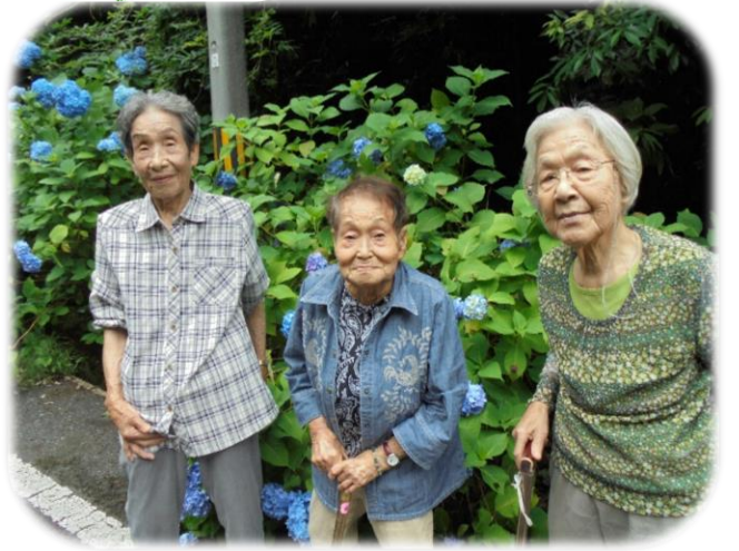
▲美祢市山中のあじさい

特養の利用者さんは山中や於福など、美祢市内のあじさいを見に行かれました。あいにくの雨でしたが車窓からあじさいが見えた途端、「綺麗に咲いちよるね。」とあじさいに見入っておられました。