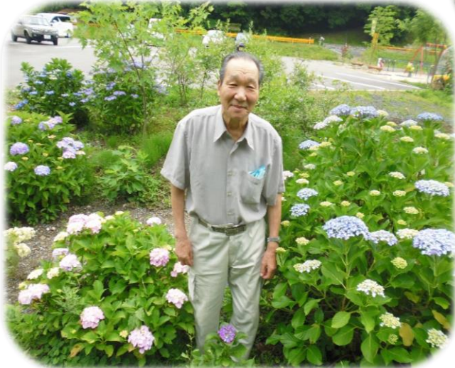
▲美祢市豊田前のあじさい

デイサービスの利用者さんは、杉原のあじさいを見に行かれました。「赤や青いのがあってきれいやね」と話され皆さん満面の笑みで記念撮影をされました。