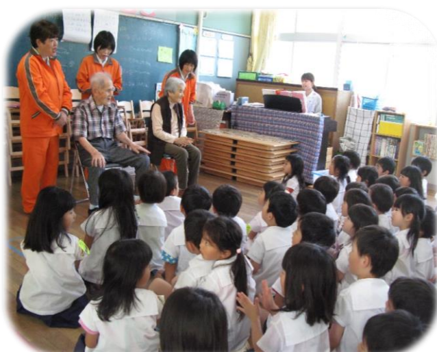
▲園児さんと一緒に「かたつむり」を大合唱

昨今、梅雨の風物詩かたつむりを見かけることが少なくなりました。美祢幼稚園の園児さん達に「かたつむり」と触れ合って頂きたいとの思いで、利用者さんと職員が30匹のかたつむりをプレゼントしました。園児さんたちはかたつむりに興味津々で触れ合っておられ歓喜の声をあげられました。