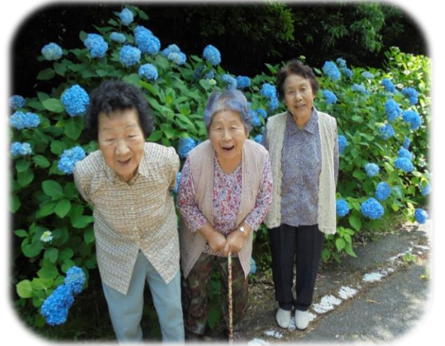
▲美祢市杉原のあじさい

特養の利用者さんは山中や於福など、美祢市内のあじさいを見に行かれました。あいにくの雨でしたが車窓からあじさいが見えた途端、「綺麗に咲いちよるね。」とあじさいに見入っておられました。